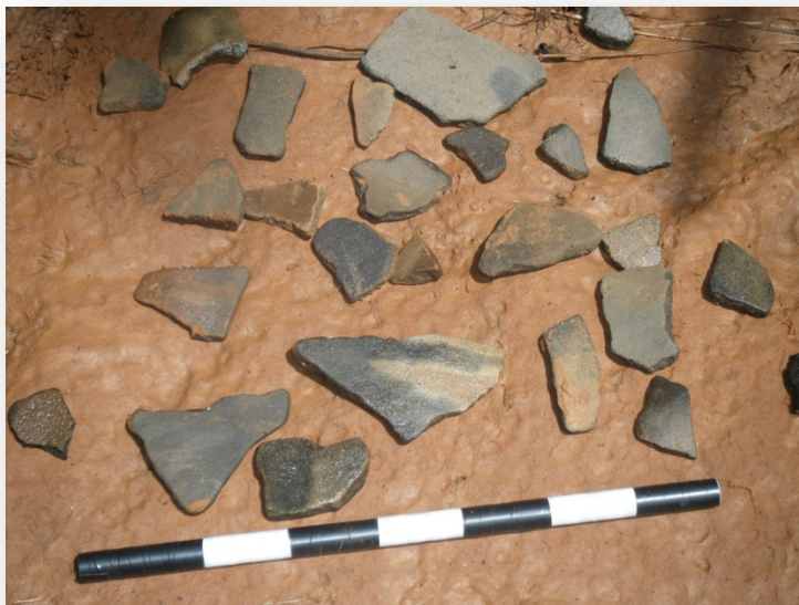
Foto 32. Restos de cerámica, Arroyo Quiquiria (comunidad Chujwara)