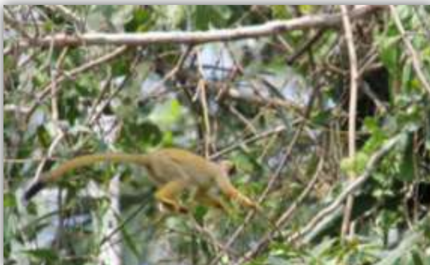
Foto 16. Mono Ardilla, Saimiri sciureus a orillas del río Beni.