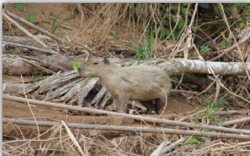
Foto 15. Capibara, Hydrochoerus hydrochaeris próximo al río Quendeque.