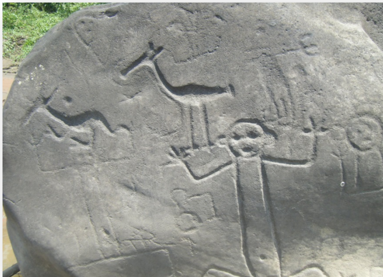
Foto 30. Sitio arqueológico Angosto Chepete.