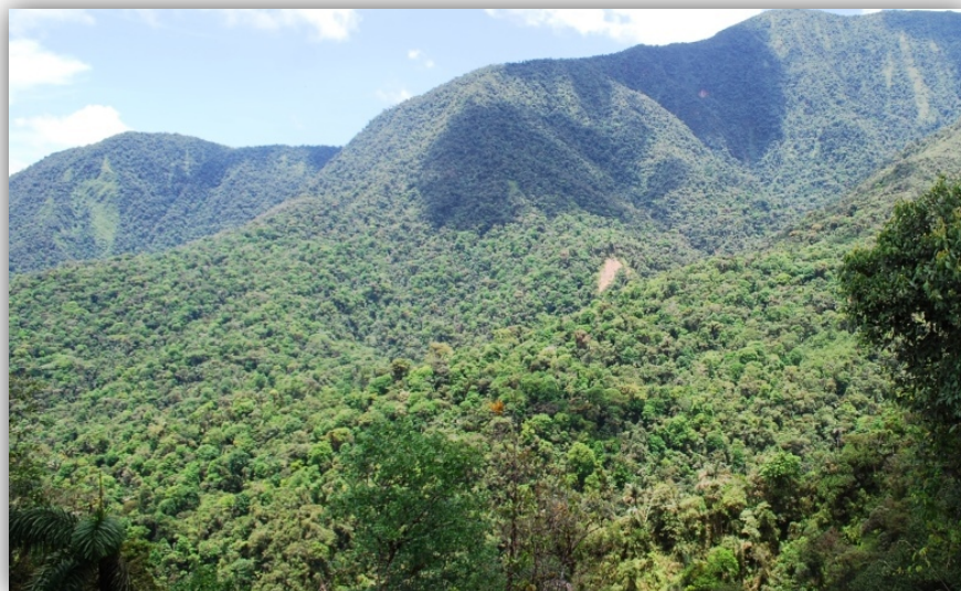
Foto 6. Bosques Siempre verdes Yungueños Basimontanos comprendido entre Sapecho y Alto Beni.