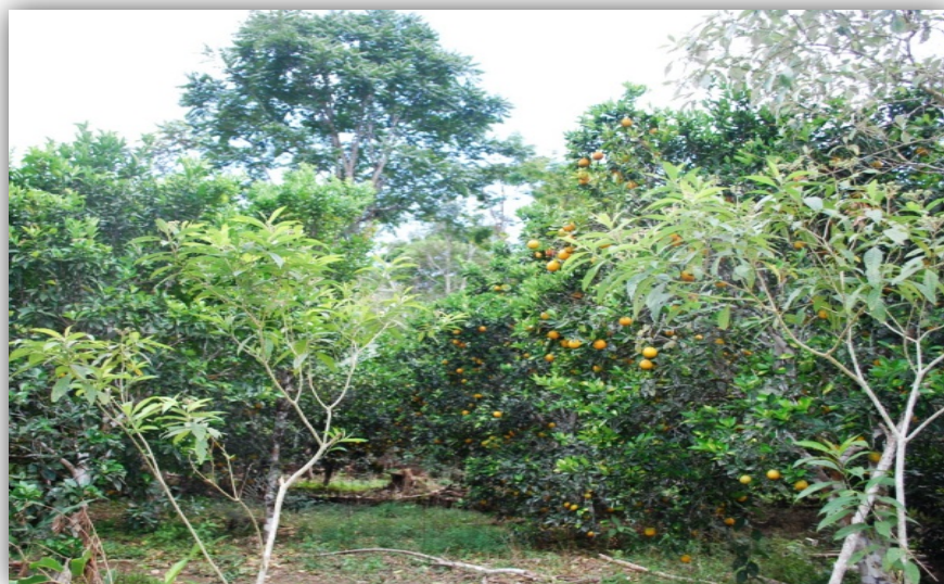
Foto 13. Cultivo de cítricos de localidad de Puerto Inicua.