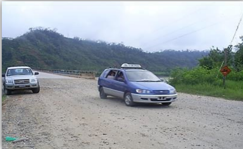
Foto 33. Servicios de transporte interprovincial, Yocumo – La Paz.