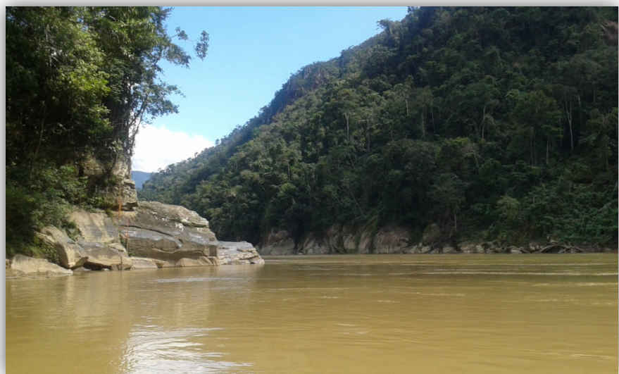
Foto 4. Vista margen derecha Angosto Chepete.