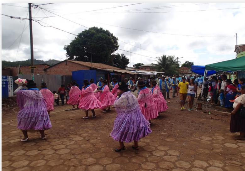
Foto 40. Identidades culturales mediante actividades folclóricas características de la zona del Estudio de Identificación del proyecto.