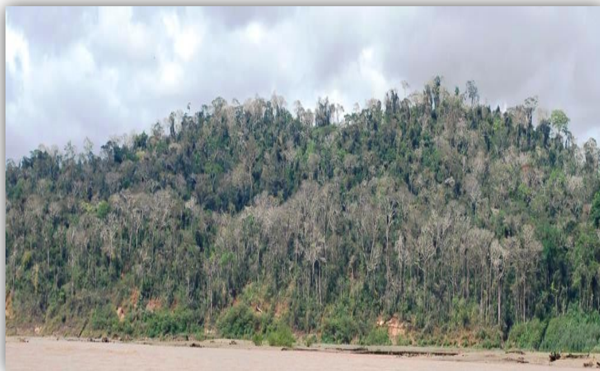
Foto 5. Bosque Semideciduo Caducifolio a orillas del Rio Alto Beni.