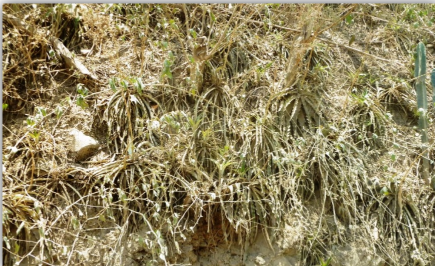
Foto 12. Comunidades Saxícolas de Fosterella sp. y Cereus sp. en Sapecho.