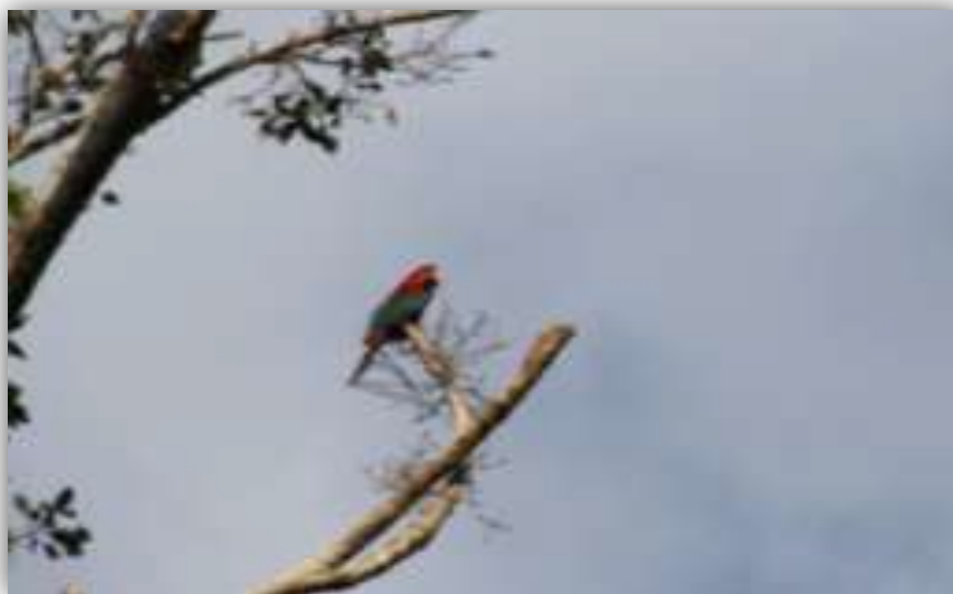
Foto 17. Paraba Roja, Ara chloropterus .