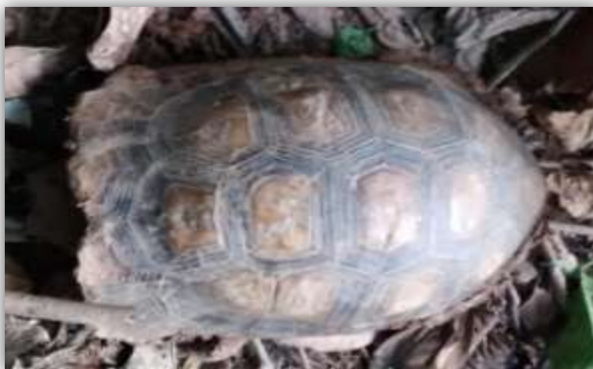
Foto 18. Peta de monte, Chelonoides carbonaria .