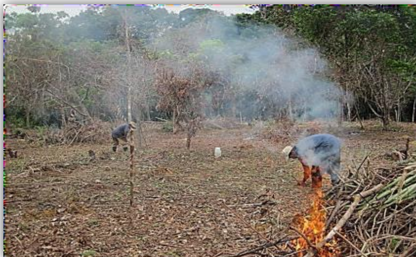
Foto 35. Actividades de roza, tumba y quema, en la zona colonizada.