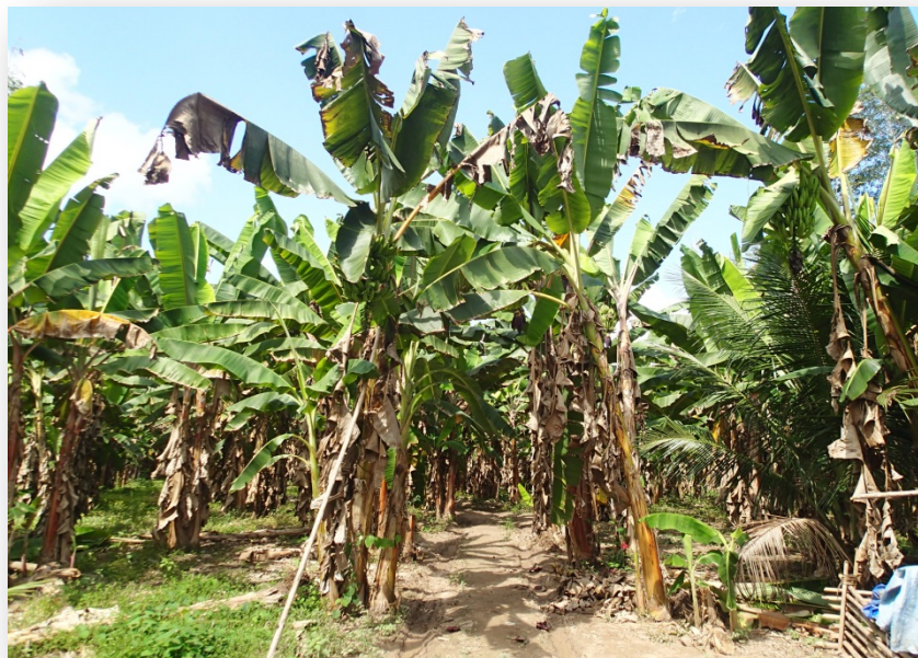
Foto 38. Cultivos de banano en menor escala en la zona colonizada.