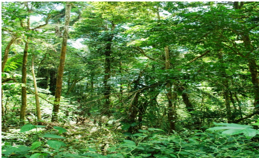
Foto 7. Interior de Bosque Siempreverde del Subandino entre Alto Inicua y Cascada.