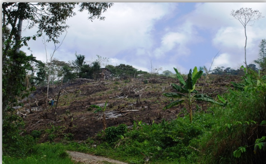
Foto 14. Apertura de nuevas áreas para agricultura.