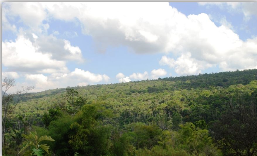
Foto 10. Bosque Yungueño Montano superior.