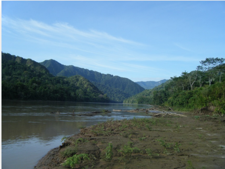
Foto 1. Angosto Chepete vista aguas arriba.