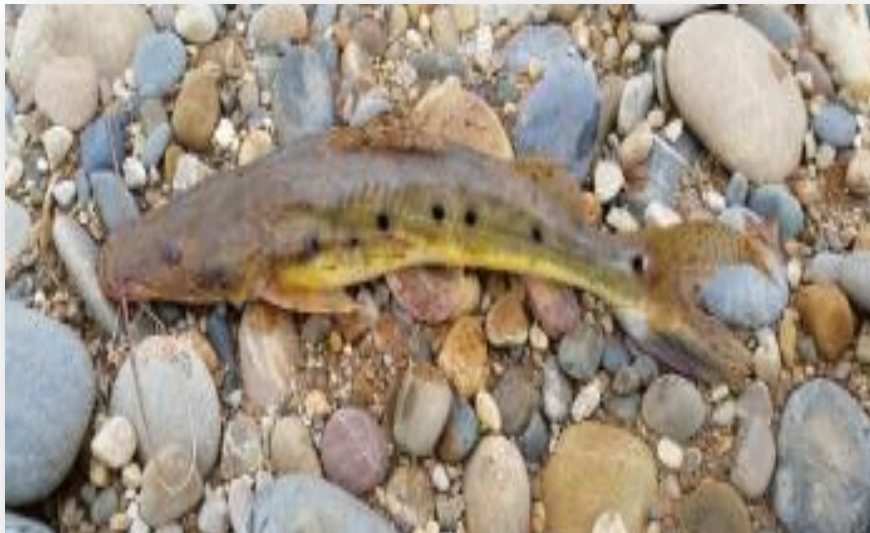
Foto 20. Hemisorubim platyrhynchos .