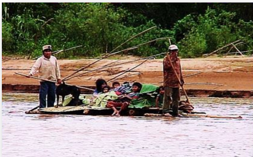
Foto 34. Angosto del Chepete, estructura ocupacional vía acuático.