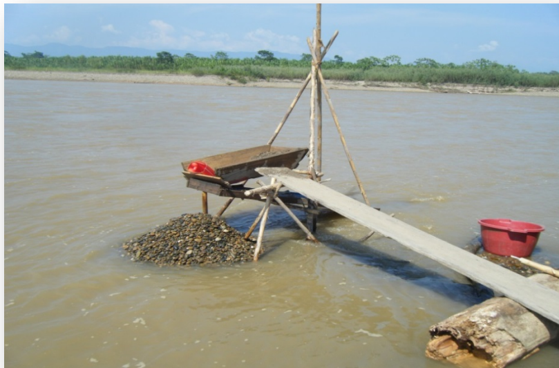
Foto 39. Actividad aurífera por comunarios de forma artesanal a orillas del río Beni.