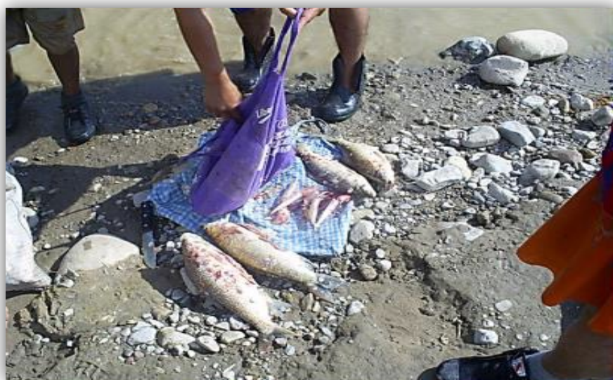
Foto 36. Actividades de pesca Puerto Icnicua.