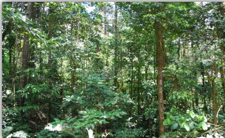
Foto 9. Interior de Bosque Siempreverde del Subandino Entre Alto Beni-Caranavi.