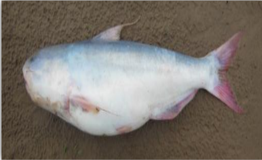
Foto 19. Cetopsis candiru .