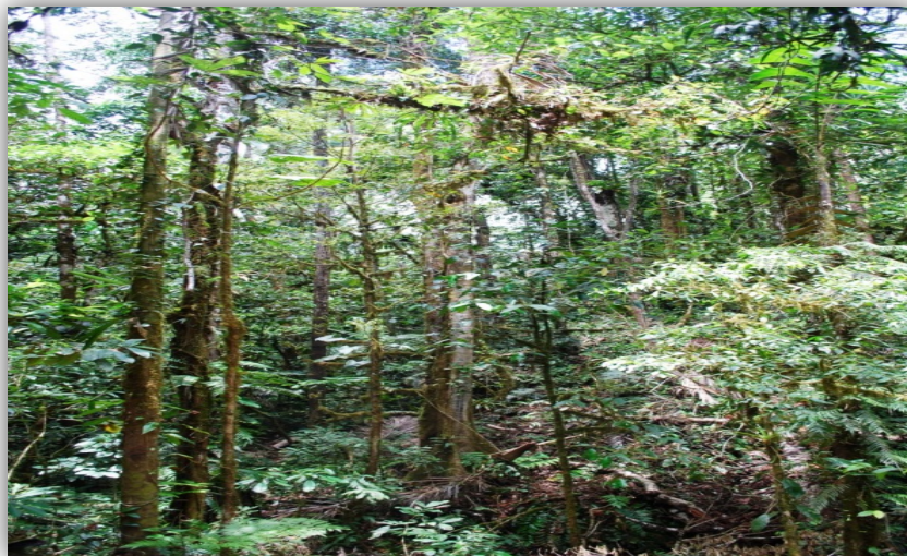
Foto 8. Interior de Bosque Siempreverde, entre Sapecho y Alto Beni.