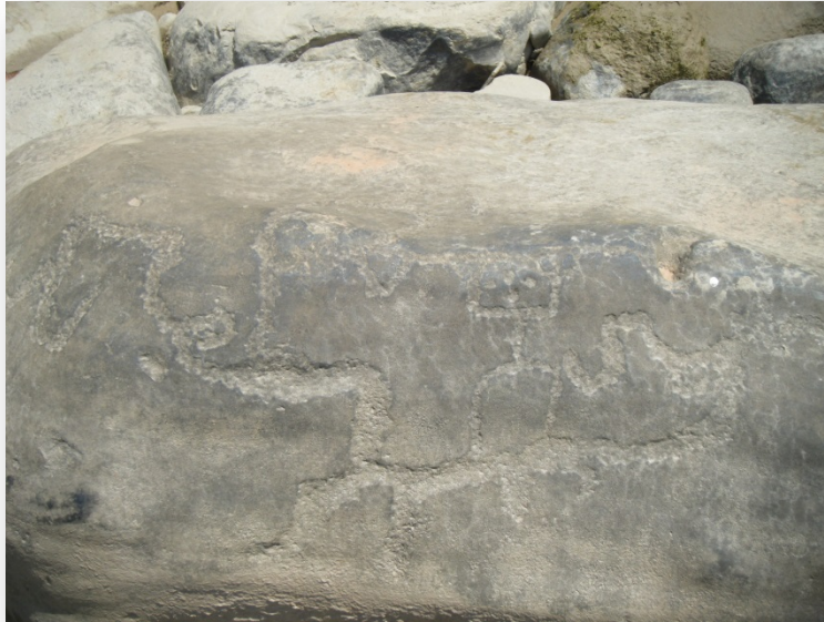
Foto 31. Sitio arqueológico Angosto Chepete.