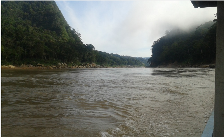
Foto 3. Vista aguas abajo saliendo del Angosto Chepete.