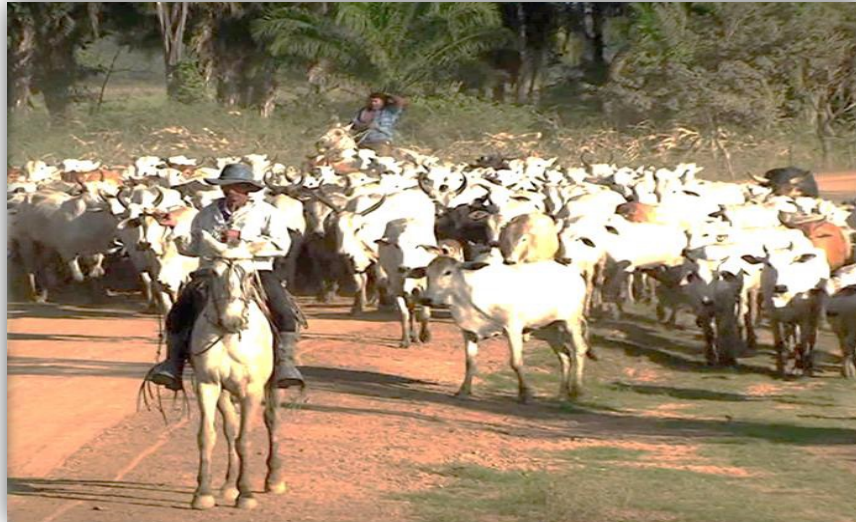
Foto 37. Actividades de ganadería en la zona colonizada.