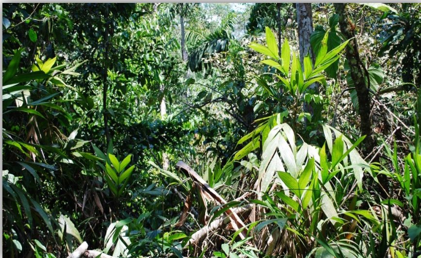
Foto 11. Bosques Siempreverdes Yungueños Basimontanos comprendido entre Sapecho y Alto Beni.