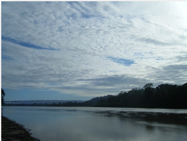
Foto 2. Vista aguas arriba antes de ingresar al Angosto Chepete.