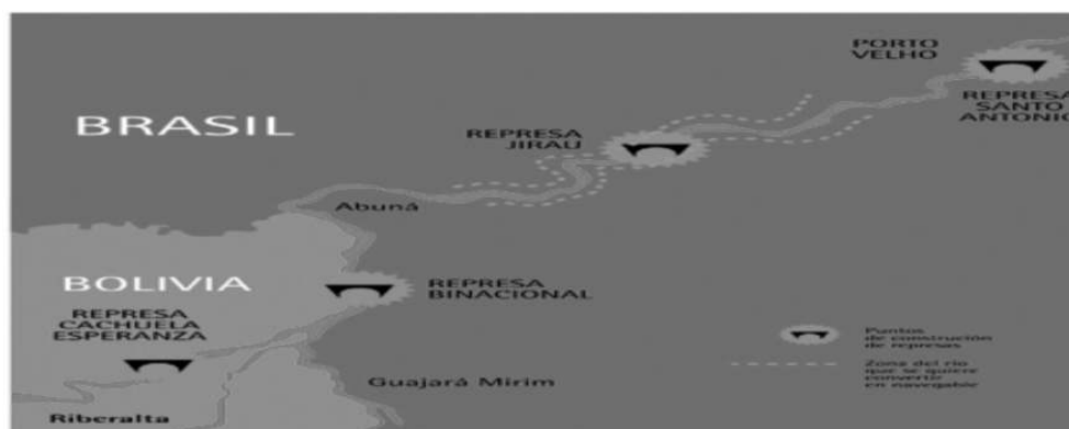
FIGURA 2. LUGAR DE REPRESAS EN EL COMPLEJO MADEIRA.