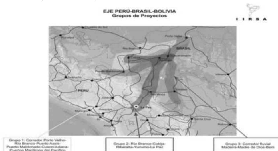
FIGURA 1. GRUPOS DE PROYECTOS DEL EJE PERÚ-BRASIL-BOLIVIA.