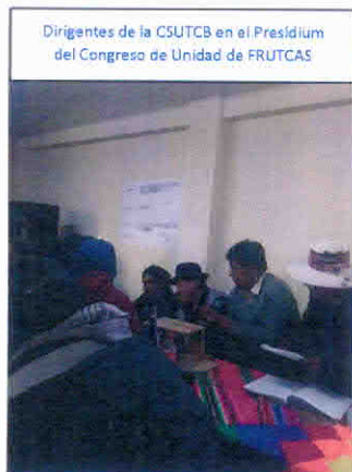
Dirigentes de la CSUTCB en el Presidium del Congreso de Unidad de FRUTCAS

Durante éste Congreso de Unidad, los dirigentes nacionales realizaron reuniones permanentes con las Centrales Provinciales, para adoptar una posición consensuada con la